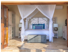
Retapado & Pulido Mate Filled & Honed