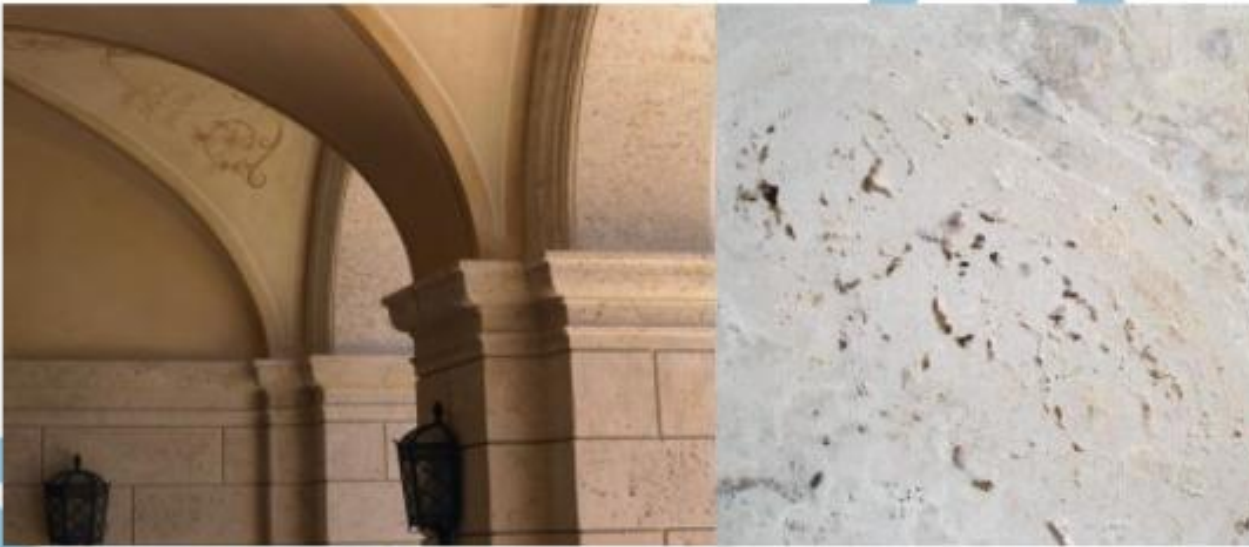
Natural Saw Cut